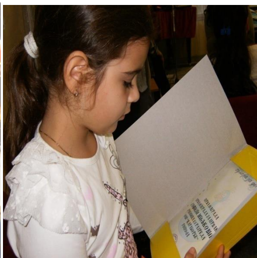
Пријем првака у Дечији савез