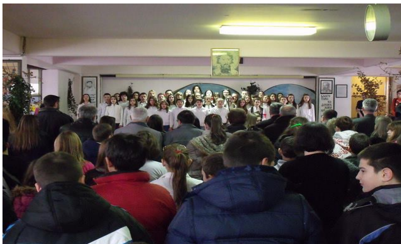
Свечаност поводом прославе Светог Саве

Школа ће укључити и све талентоване ученике да учествују на ликовним и литерарним конкурсима који буду расписани у току школске 2021/2022. школске године.